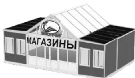
Схема работы торговой точки